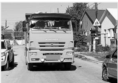
схема будет готова. После этого ее нужно будет согласовать с районной и республиканской комиссиями по безопасности дорожного движения. Только потом, на основании этой схемы, мы сможем установить на вышеназванной улице знаки, запрещающие движение грузового транспорта с массой более 3,5 т. То есть, даже водителям грузового транспорта, проживающим или работающим в зоне знака, по улице можно будет проехать без груза, а вот с грузом придется искать другие пути...

От редакции: Да, действительно, поднята очень животрепещущая тема. Технические детали пропускают интенсивный поток грузового транспорта, к тому же это является и опасным фактором. Но мы надеемся, что в текущем году АМС города приложит все усилия для решения вышеозвученной актуальной проблемы.